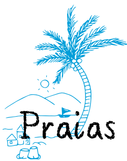
Figueira da Foz